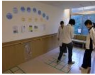
スクエアステップ

特に印象が強かったのはリハビリ室で、広いその部屋は一面が広い窓で明るく開放的でした。五、六十人の患者さんが機能訓練を受けていましたが、全ての患者さんにマンツーマンで作業療法士さんが付き添っており、十分に目が行き届いているのを感じました。