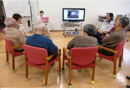
トレーニング室での共想法

す目がかかれていました。トイレは左麻痺優先トイレと右麻痺優先トイレがありそれぞれの使いやすいうように手すりが付いています。この「脳リハビリ外来」では外来に通う患者さんを対象に木曜日と金曜日に共想法を実施しています。脳トレーニングを早い時期から行うことで症状の進行防止を図る