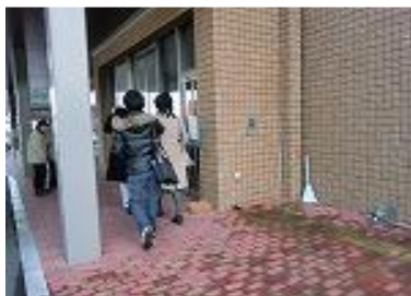
長崎北病院玄関 外↑↓内

七階建ての大きな病院で、病院を入ると広い待合室があり天井が高い吹き抜けになっています。見上げると三枚のステンドグラスが明るく輝いています。待合室は時折音楽ホールとなり、音楽会が開かれお客様は入院患者さんやご近所の方々でとても評判が良いそうです。