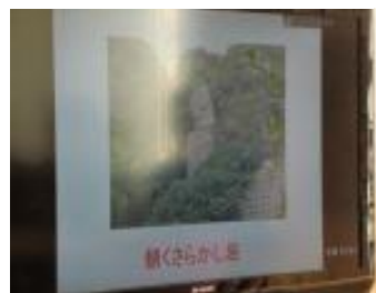
奇岩「鯖くさらかし岩」

体操を一緒にしました。椅子に座ったまま足首を曲げ伸ばし、左右に首を振る運動をします。次に椅子の背につかまって立ち、体を反らしたり片足を上げる運動は、筋肉をほぐしてリラックス出来ます。体操は少しの場所があれば出来るのを知りました。