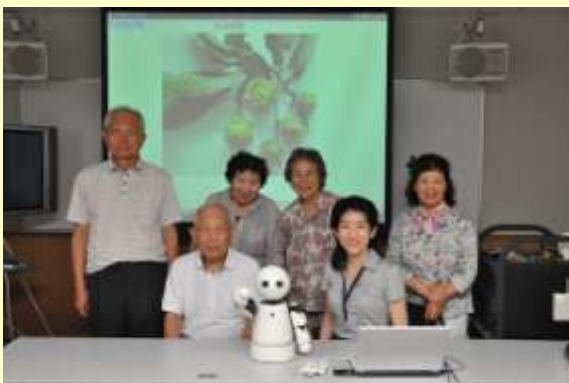
ロボット研究者と市民研究者有志