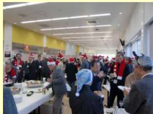
クリスマス交流会（昨年）